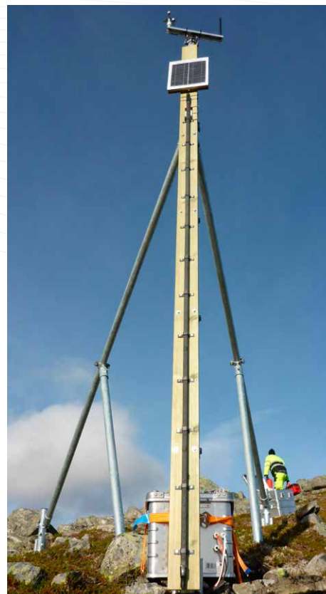
Installerte systemer med værstasjon. Loggeren plasseres enten i et skap på stang eller i en kasse på bakken.